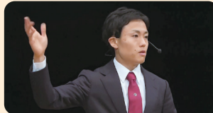
Winner of 2023 final stage (Japanese Division)