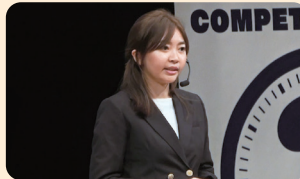
2023年大会 最優秀賞受賞者