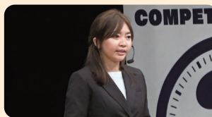
Winner of 2023 final stage (English Division)