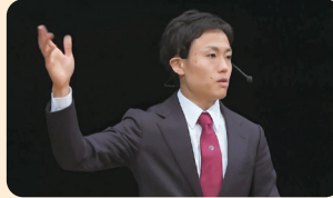
2023年大会 最優秀賞受賞者