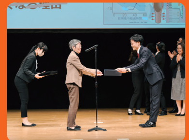
Scene from the award ceremony at last year's convention (2023)

The doctorate students will effectively showcase their research within a limited time span of three minutes in a language appropriate to a non-specialist audience. Please feel free to cast your vote to the Finalist that inspires you the most. Please complete your pre-registration in order to participate and have the chance to vote. You can find more details about the Finalists and pre-registration on our official website.