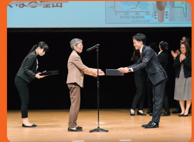
2023年大会 授賞式の様子

博士課程学生が、3分間の限られた時間内に、たった1枚のスライドのみを使って自身の研究のビジョンと魅力を分かりやすく語ります。全国から動画審査を勝ち抜いたファイナリストたちの発表に心動かされたら、是非1票を投じてください。事前申請していただければ、大会中に投票していただくことができます。発表者情報、事前申請方法等は大会公式サイトをご参照ください。