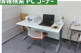
情報検索 PC コーナー

企業情報や求人情報、就職に関する情報検索ができます。また、応募書類の修正や、ジョブカード作成でパソコンが利用できます。